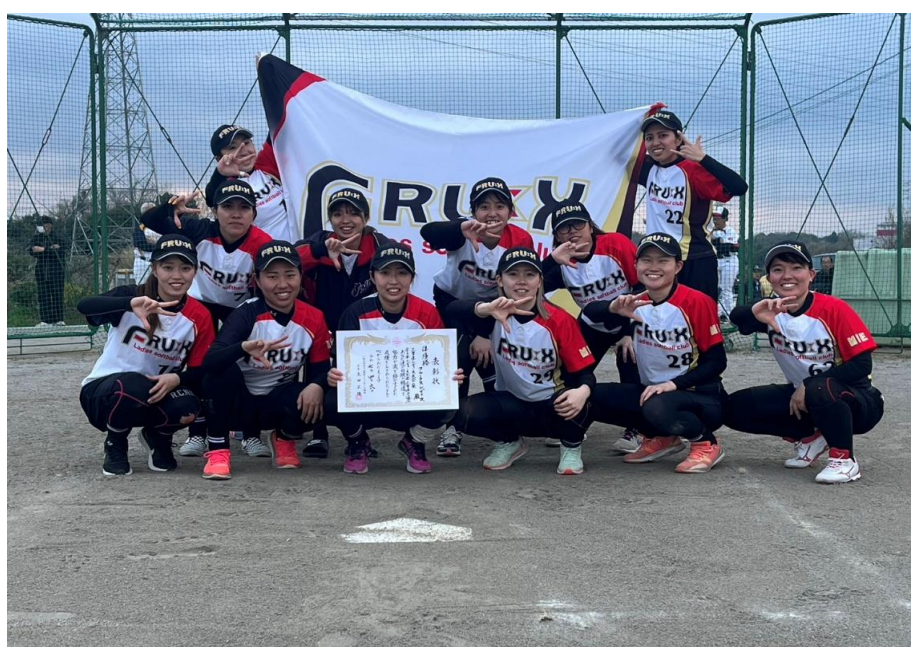
【準優勝】フルークスレディース(桑名支部)