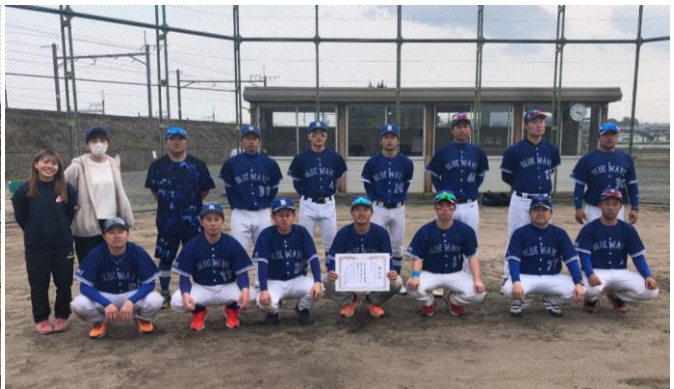
【準優勝】BLUEWAVE三重SC(多気支部)