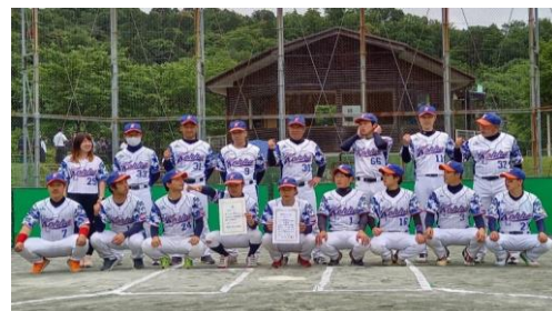
【準優勝】硬派クラブ(愛知) ↑