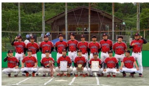
【優勝】日本エコシステム(岐阜) ↑